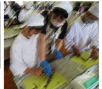
5・6年 魚さばき体験