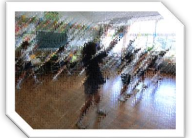
（ソーラン全体練習）