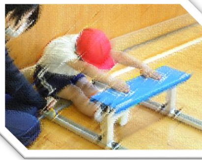
「おいしょっ…体前屈」