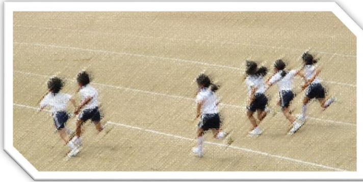
「負けなぞ！（リレー選手選考）」

6月に延期されましたが、予定通り子どもたちは練習に励んでいます。「河内っ子ソーラン」では、6年生が下級生に動画を使って細かくやさしく教えるなど、頼もしい様子が見られました。全体練習では、全員がしっかり話を聞き、一人一人が力いっぱい踊ることができていました。また、リレー選手選考や競争遊戯の練習でも、みんな精いっぱい力を出して、取り組んでいるのがすばらしいです。