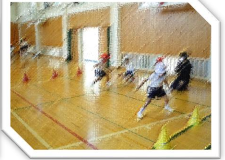
「いちっ、にっ、さんっ…反復横跳び」