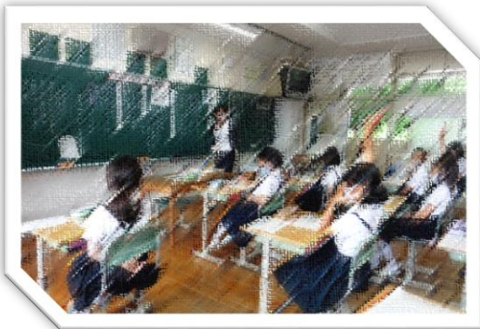
「さっと手が挙がいます！」