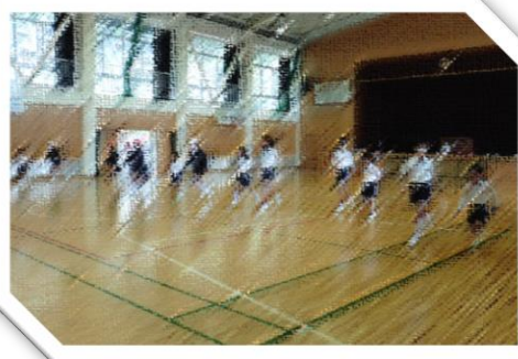
「はあはあ…シャトルラン」

毎年新学期に行っている体力テストですが、1年生は初めてで、ドキドキ。6年生にやり方を教えてもらいながら、がんばりました。