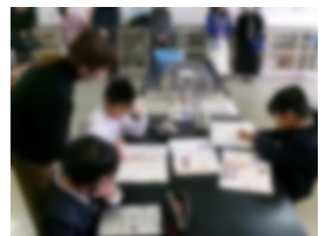
【1年：「できるようになったこと」発表会】