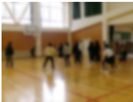
【3年：「きらり!べに花たんていだん☆」発表会】